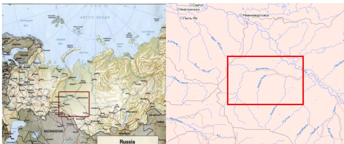
Рис.1. Восточно-хантыйский ареал: р. Васюган.