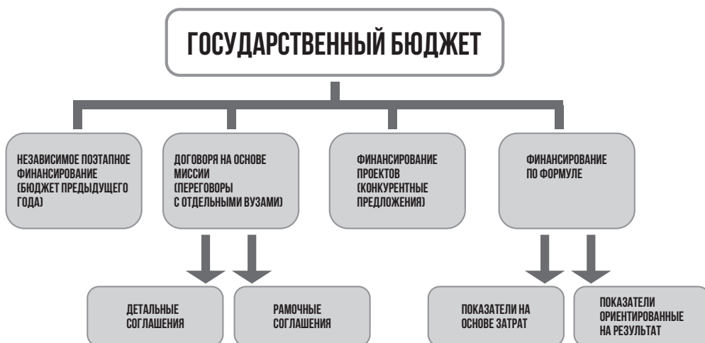
Рисунок 2. Варианты финансирования вузов государством.

Разумеется, в зависимости от национального контекста и целей может быть выбрана комбинация различных вариантов финансирования и показателей.