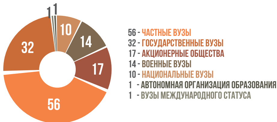
Рисунок 3. Казахстанские вузы по видам собственности и деятельности