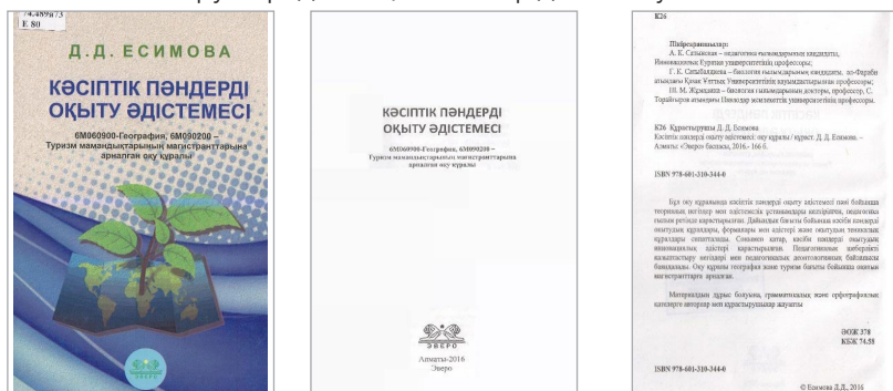
Рисунок 3. Пример некорректного представления автора издания

На Рис. 3 приведен пример некорректного представления издательством имени автора книги. На ее обложке приведена фамилия автора – Д. Д. Есимова. На титульном листе ее уже нет. На обороте титульного листа в описании указано – Құрастырушы Д. Д. Есимова. Как каталогизатору определить, кто автор данного учебного пособия?